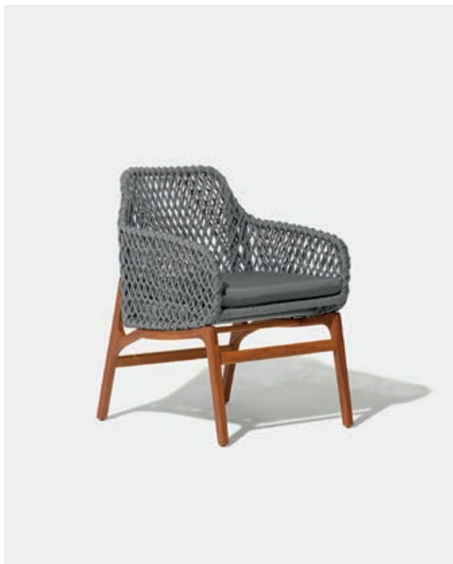
CADEIRA CORDA ANU7 — A82 / L60 / P69