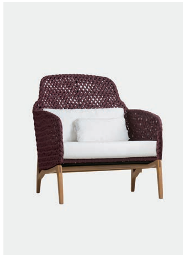
POLTRONA CORDA ANU1 — A95 / L80 / P89