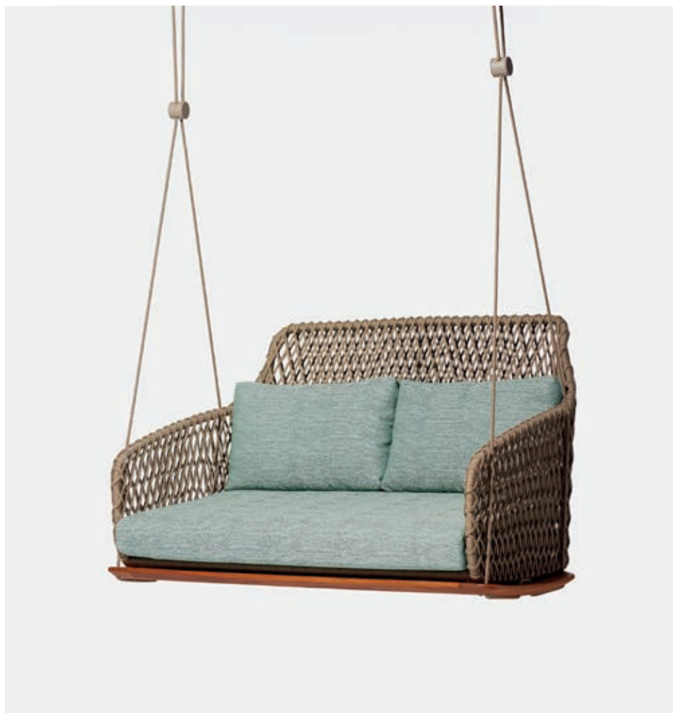
NAMORADEIRA SUSPensa CORDA ANU12 — A58 / L130 / P86