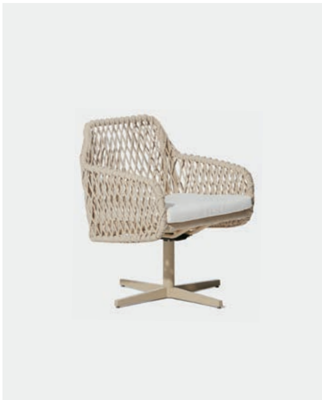
CADEIRA GIRATÓRIA ANU13 — A79 / L56 / P59