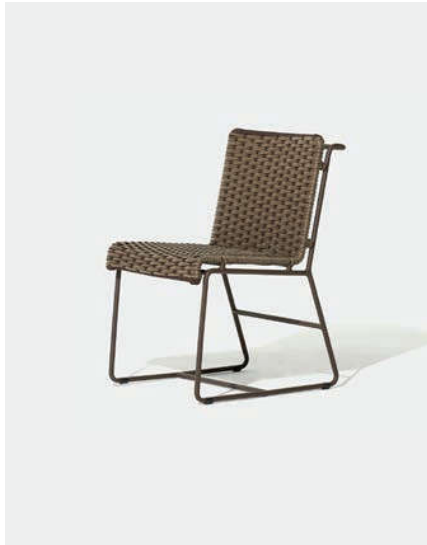
CADEIRA SEM BRAÇOS DOC3 — A78 / L48 / P61