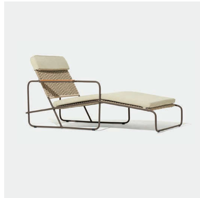
CHAISE BRAÇO DIREITO SEM ALMOFADA DOC4 — A70 / L147 / P72