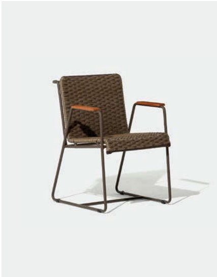
CADEIRA DOC2 — A78 / L57 / P61