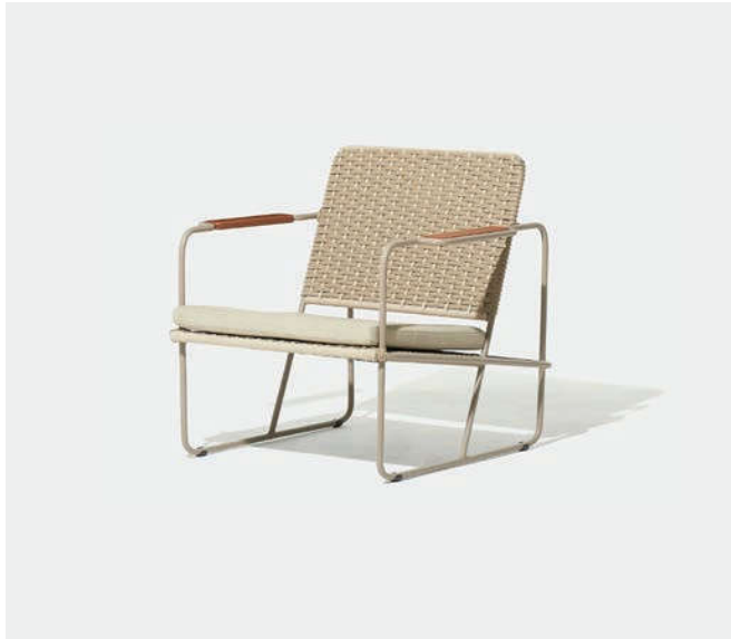
POLTRONA DOC6 — A78 / L76 / P80