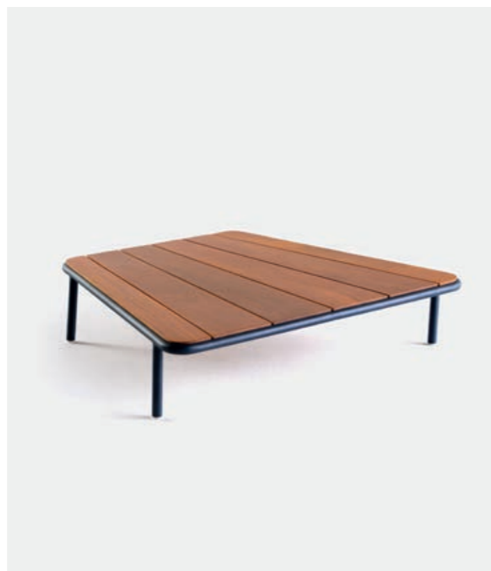
MESA CENTRO COM MADEIRA VN8 — A22 L70 / P68