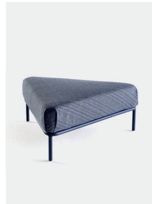
MÓDULO CANTO TRIANGULAR VN3 — A40 / L94 / P84