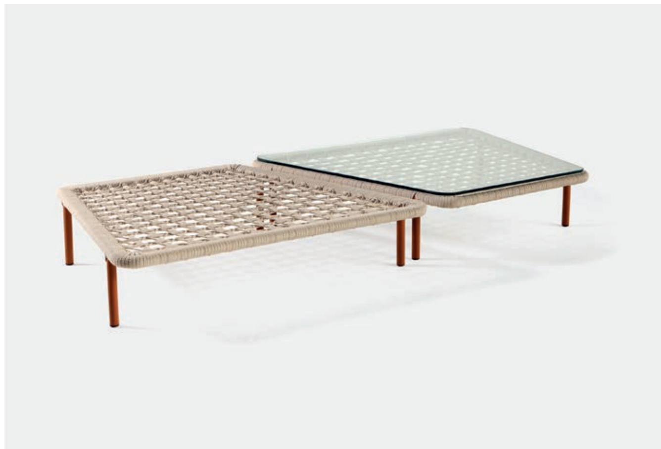
MESA DE CENTRO COM VIDRO E TRAMA VN4 — A22 / L70 / P68 VN7 — A22 / L103 / P87