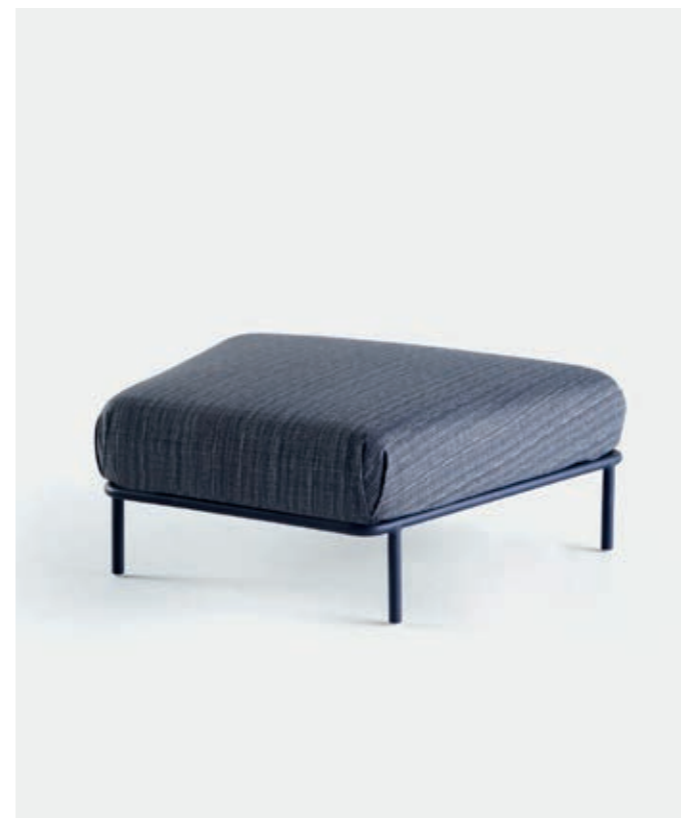
MÓDULO PUFF VN5 — A40 / L101 / P88