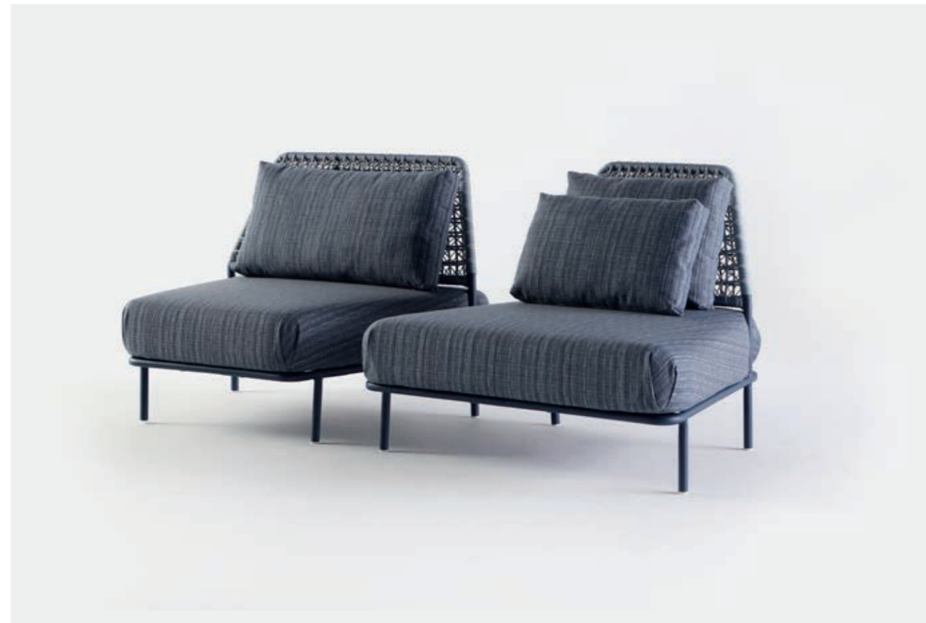
MÓDULO ENCOSTO MAIOR VN2 — A81 / L101 / P88